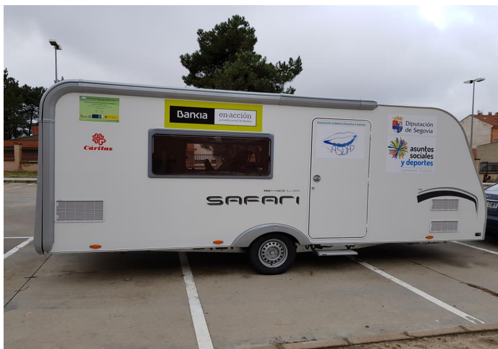
Unidad dental móvil ASDAS en Cantalejo

En el mes de agosto no hubo atención sanitaria, a los pacientes de Segovia, ya que la asociación llevó a cabo un proyecto solidario en Nador, Marruecos.